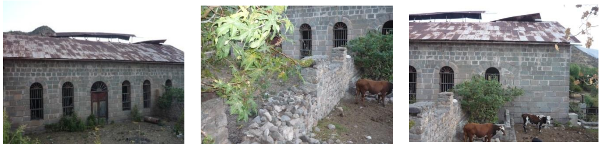
Hacienda Marcawasi (hacienda cañaveral)

Distrito que alberga a la hacienda Marcawasi que durante 1931 estuvo a cargo del Sr. David Samanez Ocampo y las haciendas San Francisco de Alberto León, La Estrella a cargo del distrito afectados por la Reforma Agraria en el periodo de Velasco Alvarado.