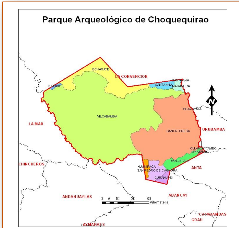
Conformación Política y Límites del ámbito del Parque Arqueológico de Choquequirao