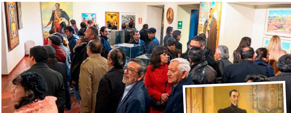
Retrato del "Inca Garcilaso de la Vega", obra de Francisco Gonzalez Gamarra.